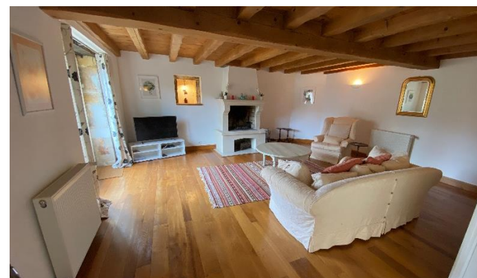
Maison Coriandre 10-12 personnes