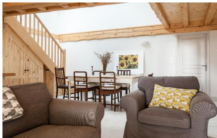
Maison Origan 10-12 personnes