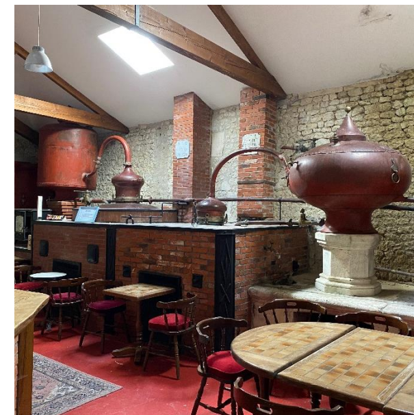
La Distillerie 20 personnes