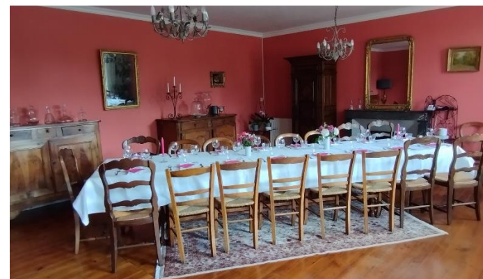
Salle à manger 20 personnes