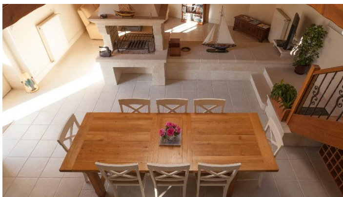
Maison Romarin 15-20 personnes