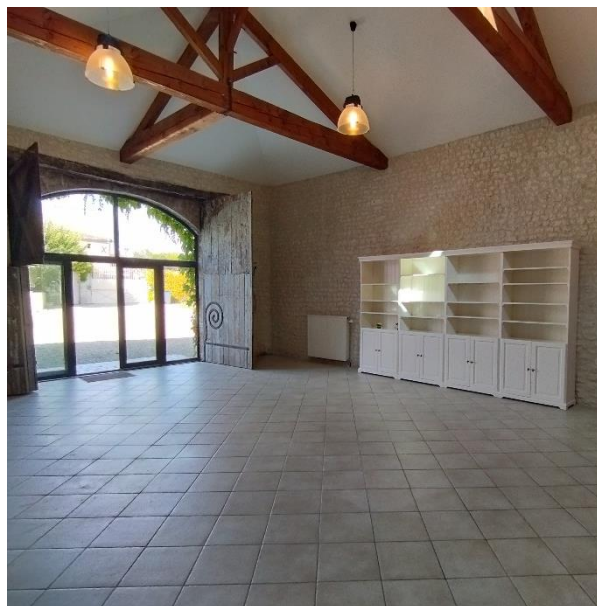
La Part des Anges 49 personnes